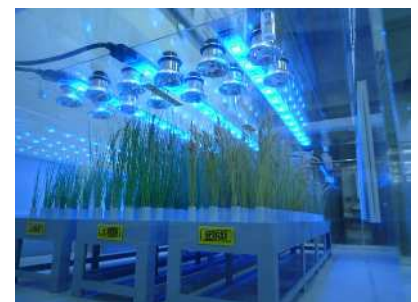
遺伝子組換えイネの栽培室 (展示予定の模型)