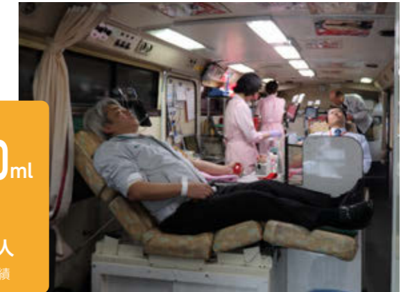
大阪支社での集団献血